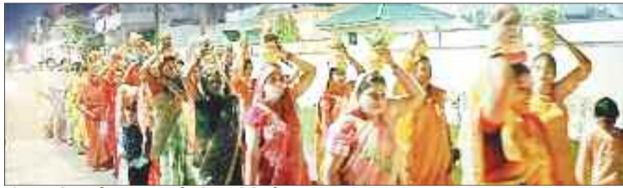
शोभायात्रा निकालती साहू समाज की महिला समिति की सदस्य।