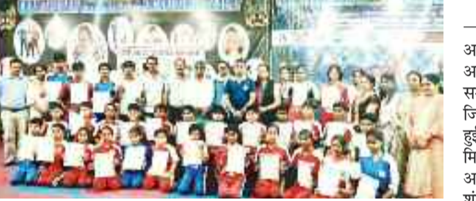
राज्य स्तरीय प्रतियोगिता में चयनित प्रतिभागी।