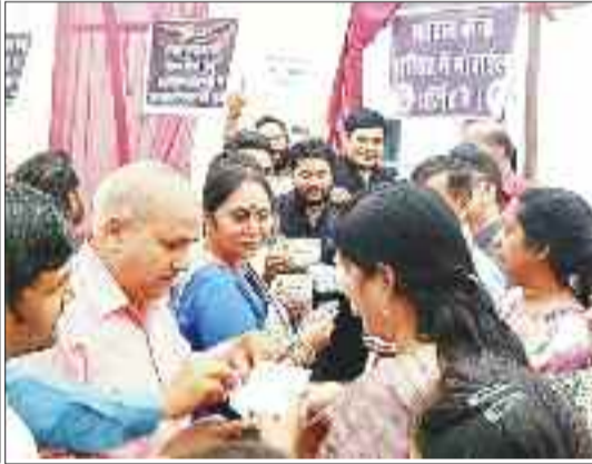
प्रत्याशियों से घिरे मतदाता।