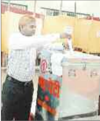
मतदान करते मतदाता।