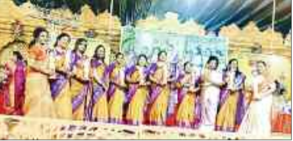
सम्मेलन में शामिल महिलाएं।