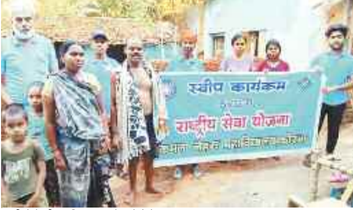
ग्रामीणों के बीच अभियान चलाते रासेयो के सदस्य।

संपर्क कार्यक्रम के दौरान 18 वर्ष की आयु पूर्ण कर चुकी एक बालिका का ऑनलाइन मतदाता परिचय पत्र बनाने का कार्य भी स्वयंसेवकों द्वारा किया गया। अटल बिहारी वाजपेयी विश्वविद्यालय