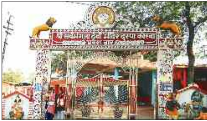
हरिभूमि न्यूज ►► कोरबा