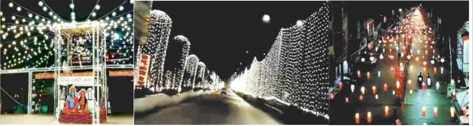
हिन्दू नववर्ष की तैयारी में टीपी नगर चौक में भगवान राम की आकर्षक झांकी, रोशनी से सजा टीपी नगर मुख्य मार्ग एवं पॉवर हाउस रोड में नजर आ रही रंग बिरंगी झालर।