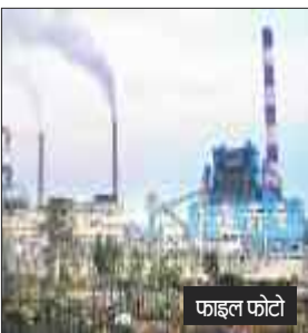
हरिभूमि न्यूज ▶▶ कोरबा

प्रदेश में बढ़ते औद्योगिकरण से ऊर्जा की जरूरतें तेजी से बढ़ रही हैं। बिजली की मांग में सालाना साढ़े सात फीसदी का इजाफा हो