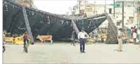
सुनालिया पुल में बनाया गया टेंट हवा में गिरा।

हवाएं चल रही थी, साथ ही आसमान पर बादल छाए हुए थे। मौसम में बदलाव की वजह से कहीं-कहीं पर हल्की बूंदबांदी भी